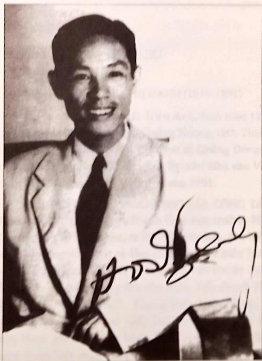
Nhà thơ HỒ DZẾNH